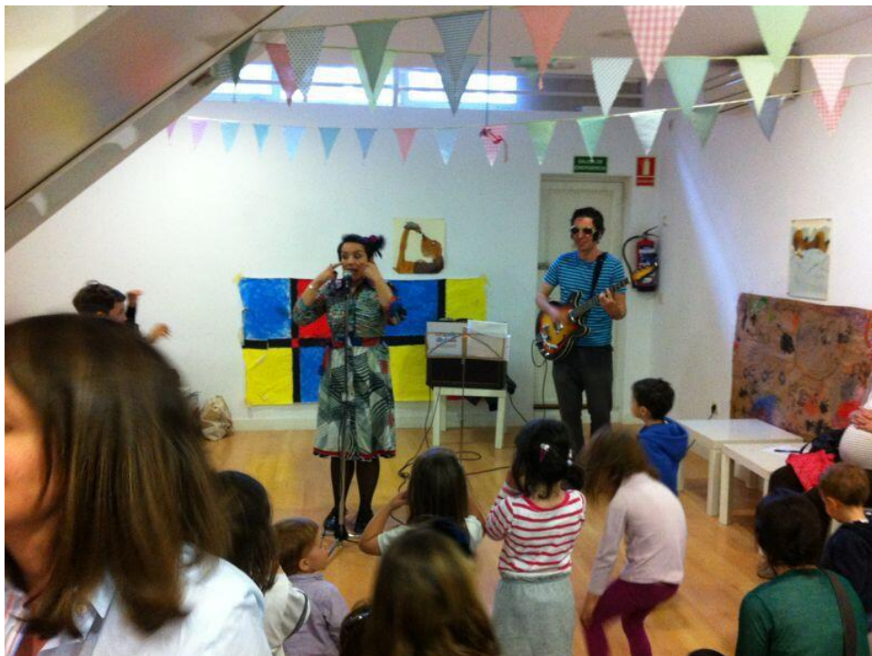
Music In Action en la noche de los libros en Librería Pepa Luna (Abril 2013)