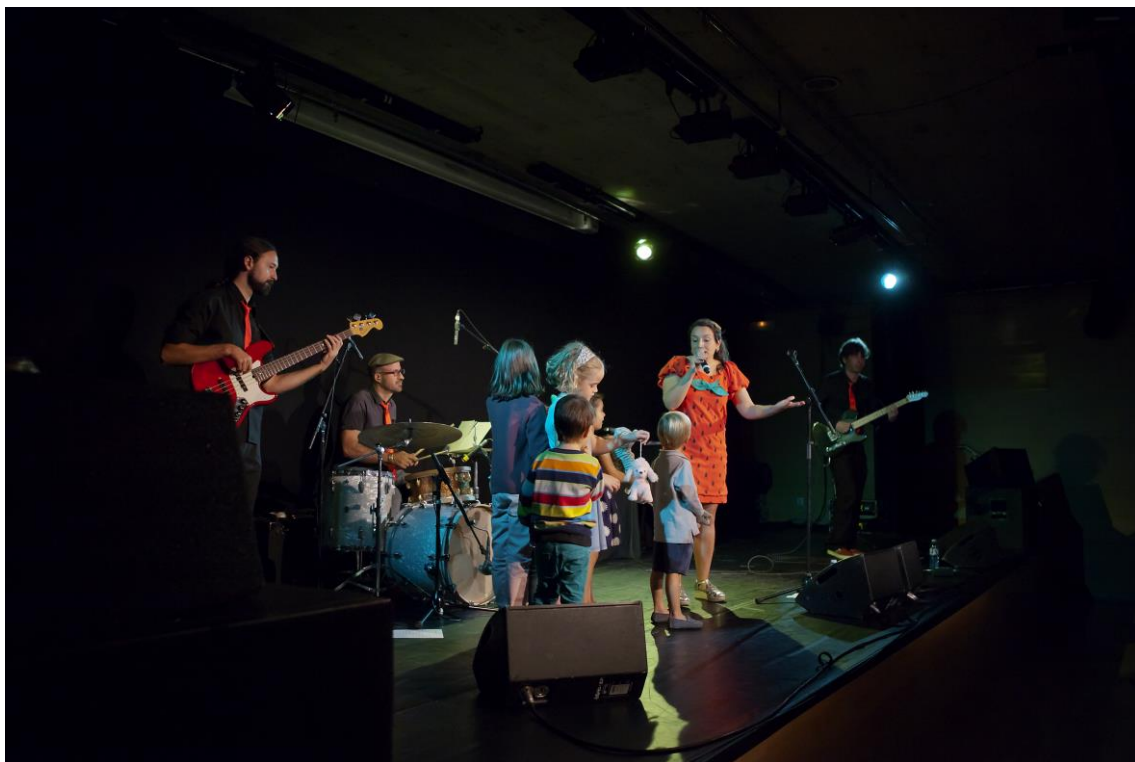
Music in action en La Casa Encendida ciclo " La Caja de Música" Octubre 2015.