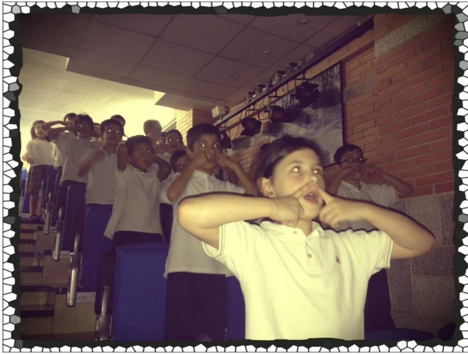
Alumnos del colegio Gredos San Diego Vallecas Abril 2014

En definitiva, Un concierto de Music In Action es el complemento ideal para reforzar el aprendizaje del inglés en un contexto animado a la par que divertido y a su vez acercar la música en vivo a los niños.