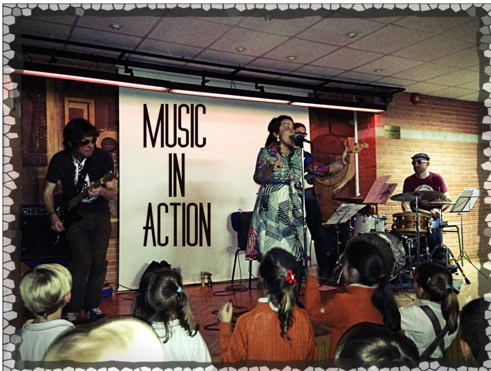
Music In Action en el Colegio Gredos San Diego Vallecas (Abril 2014)