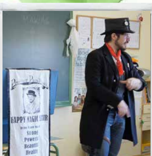
Wild Wild West