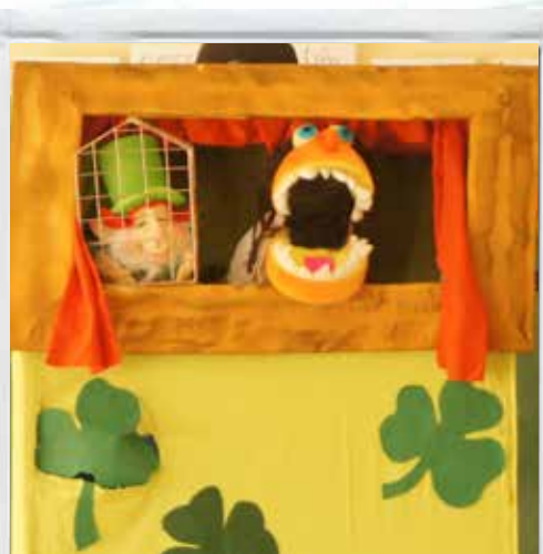
Welcome to Ireland

La India es una región compleja, diversa, viva y rica y no hay nadie mejor que Rudyard Kipling y sus cuentos para explicarlo. Risas, bailes, música y cultura, harán que los alumnos disfruten de una mañana inolvidable viajando por este bello país mientras conmemoran con nosotros el 150 aniversario de Kipling. (Primaria)