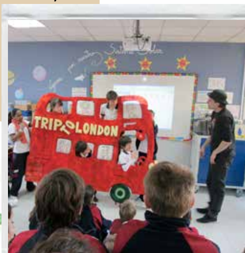
TRIP TO LONDON

Un viaje al lejano Oeste hará que los niños vayan en diligencia, asistan a una fiesta rodeo, conozcan cuentos clásicos indios, prueben elixires mágicos, hablen con Tom Sawyer... Una auténtica aventura de indios y vaqueros. (Primaria)