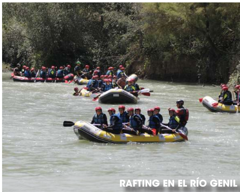
RAFTING EN EL RÍO GENIL