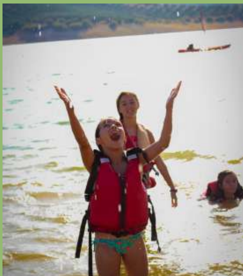
ACTIVIDADES NÁUTICAS EMBALSE IZNAJAR