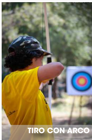
TIRO CON ARCO