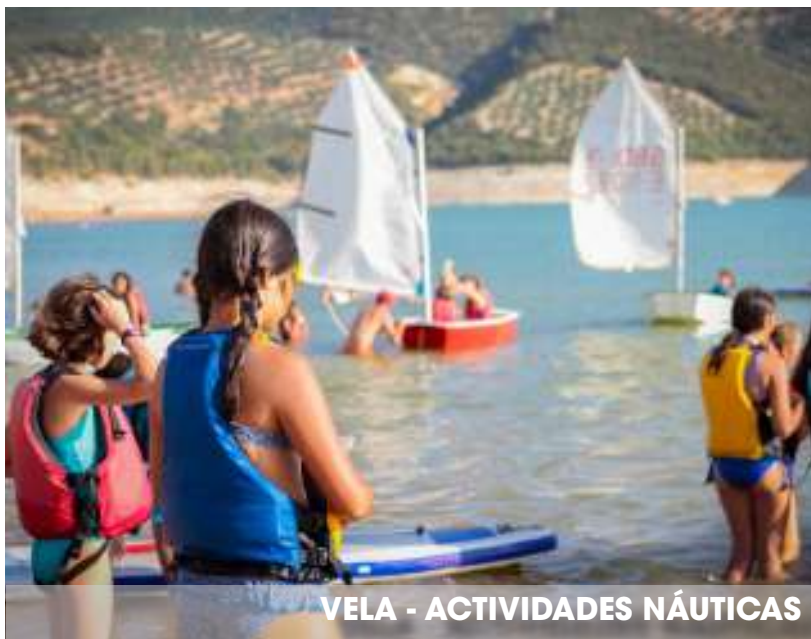
VELA - ACTIVIDADES NÁUTICAS