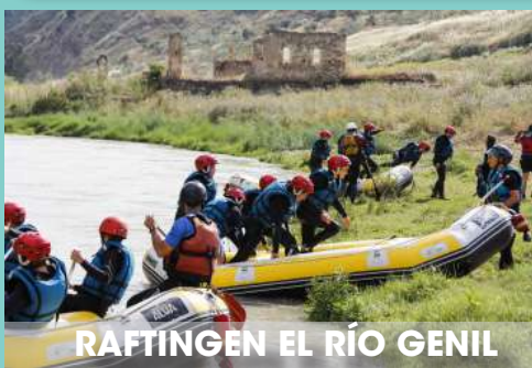
RAFTING EN EL RÍO GENIL