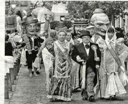
Pasacalles por San Cayetano, San Lorenzo y la Virgen de la Paloma, ayer en el centro de Madrid

Durante el pregón, muy aplaudido por todos los asistentes, el conocido actor destacó, no sólo la tradición de las fiestas, sino también la riqueza que le aportan la presencia de los nuevos vecinos de los barrios del centro, llegados de di-