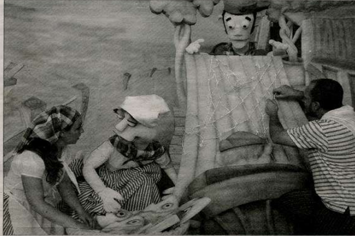
La compañía Zarzuguiñol presentará un espectáculo homónimo mañana en el Teatro Circo. / M.A.

SÁBADO 12 DE ABRIL DE 2008 LA TRIBUNA DE ALBACETE