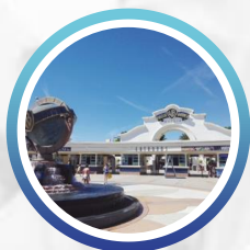
Madrid – Toledo