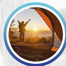
Campamento en la Sierra de Córdoba